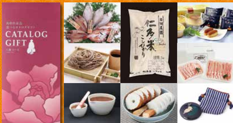
※商品紹介は一例です。

4,000円分を抽選で700名の皆様に 島根県産品選べるカタログギフトが当たる!!