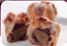
ご縁づつみ(栗餅パイ)