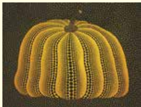
(A PUMPKIN) 2007年