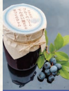
ブルーベリージャム