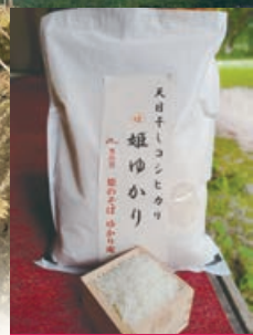
仁多米こしひかり(姫ゆかり)