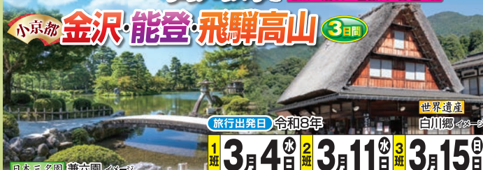
日本三名園 兼六園 イメージ