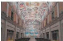
システーナ・ホール

世界26ヶ国、190余りの美術館が所蔵する西洋名画1000余点を陶板で原寸大に再現し、展示しています。写真は大塚国際美術館の展示作品を撮影したものです